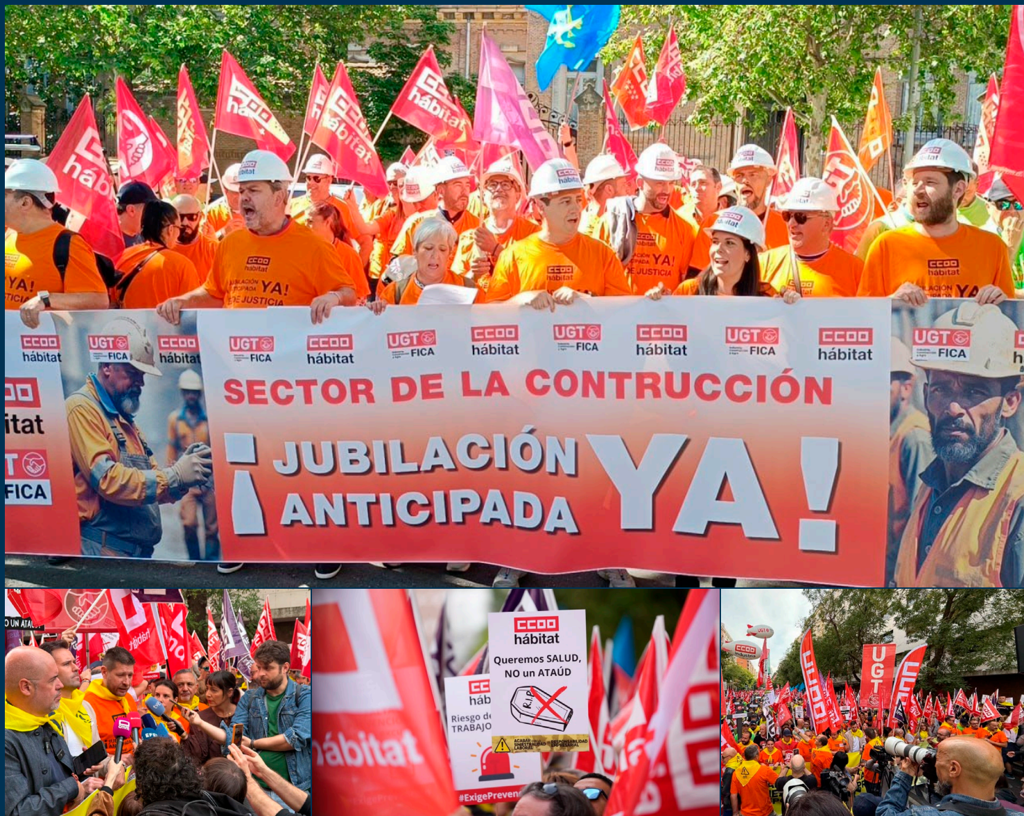
Fotografías: Imágenes de las concentraciones contra la siniestralidad laboral del 16 de octubre y por los coeficientes reductores del 21 de mayo.

Por todo esto, es importante afiliarse a CCOO del Hábitat para seguir ganando en derechos , ya que cada avance viene de la mano de la afiliación y de nuestra fuerza colectiva a través de las elecciones sindicales y la negociación y seguir en la lucha contra la siniestralidad y conseguir los coeficientes reductores.