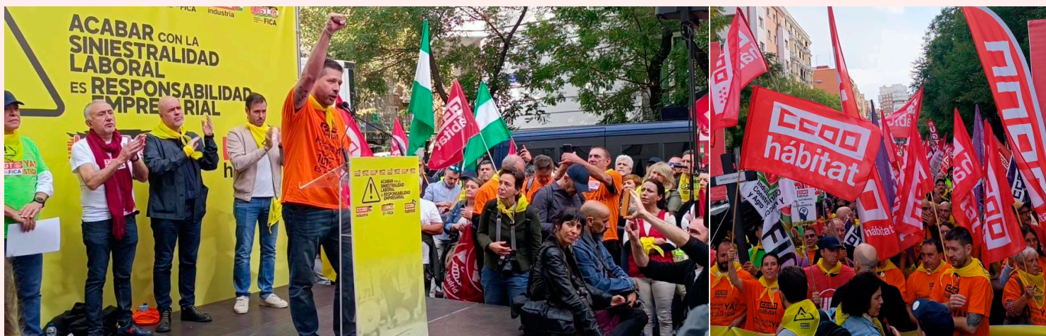
Fotografías: Multitudinaria concentración frente a la sede de la CEOE del pasado 16 de octubre.

El 2025 ha sido el año en el que hemos dicho alto y claro que el trabajo no puede costarnos la vida y que jubilarse anticipadamente con salud ¡es de justicia!